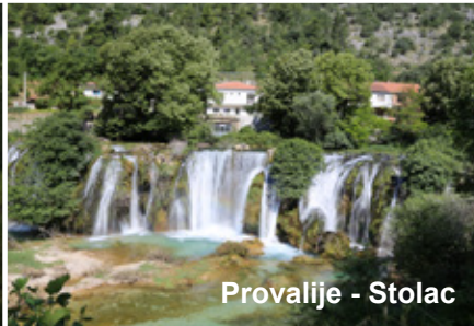
Provalije - Stolac